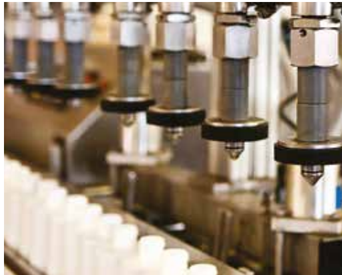
Собственная торговая марка